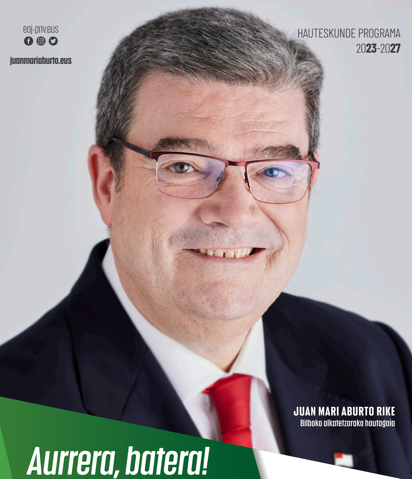
JUAN MARI ABURTO RIKE Bilboko alkatezarako hautagaia